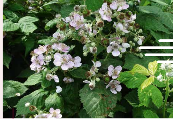
Dijkviltbraam in bloei

Het Zeeuws Landschap ziet op steeds meer plekken in hun gebieden een overwoekering met dijkviltbraam waardoor andere kruiden langzaam maar zeker verdwijnen. Als Raad en Daad-vraag heeft het OBN de twee auteurs ingeschakeld om eens op een rij te zetten welke mogelijkheden er zijn om dijkviltbraam in toom te houden of liever nog kwijt te raken. Eind dit jaar verwachten de auteurs met een eerste advies te komen waarbij ze in ieder geval een overzicht willen presenteren van gelukke en mislukte pogingen om de soort in toom te houden.