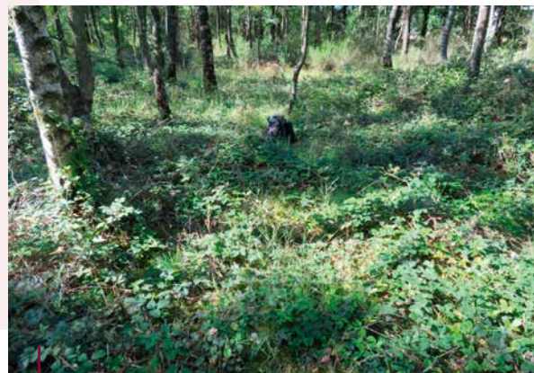
Dijkviltbraam bij Schaarsbergen

schijnlijk vooral een kwestie geweest van het citeren van ondeugdelijk of onvolledig onderzoek. Dat lijkt zich in de loop der jaren te hebben versterkt waar braam het nitrofiële imago aan heeft te danken. "Wij sluiten zeker niet uit dat hoge, voortgaande stikstofdepositie en daarmee hoge N-beschikbaarheid leidt tot snellere, meer of persistentere dominantie van bepaalde braamsoorten. Ook de algehele eutrofiëring van het Nederlandse landschap kan hieraan bijgedragen, maar sterke aanwijzingen hiervoor zijn ons niet bekend."