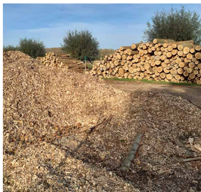
Toediening van restmateriaal van bomen stimuleert schimmels in akkerbodems.