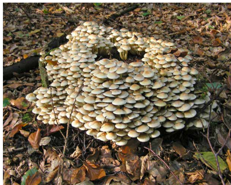
Links: Paddenstoelen van de gewone zwavelkop op een dode stam. Rechts: Proef met kolonisatie van beukenhoutblokjes op bosgrond door schimmeldraden van de gewone zwavelkop.