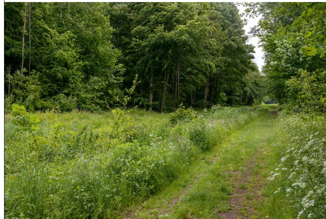
In Flevoland is wat betreft versterking van de bosvitaliteit aandacht voor boomsoortenmenging, toekomstbestendige boomsoortensamenstelling, een gezonde waterhuishouding en een passende wildstand.

De Bossenstrategie wordt uitgewerkt in de Limburgse aanpak Bossen. Hierin staan ongeveer zestig acties beschreven. Deze zijn verder geconcretiseerd in de Uitvoering Limburgse aanpak Bossen. De meest concrete acties zijn gericht op bosuitbreiding en bosrevitalisering.