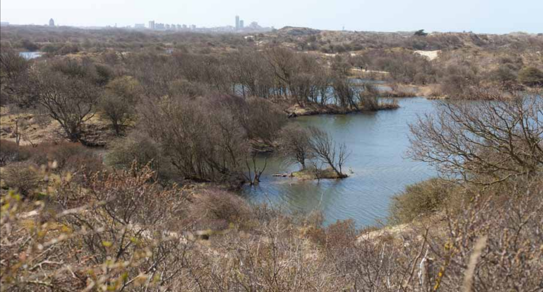
Meijendel met waterwinplas en skyline Den Haag.