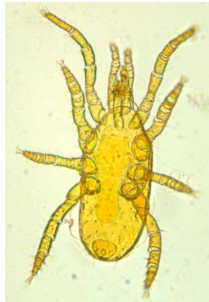
Hypoaspis praesternalis (roofmijt van onderen, lengte 0.4 mm)

De verschuiving van schimmeleeters naar omnivoren zien we ook in bodems van recent geplagde heidevelden. De balans naar meer schimmeleeters