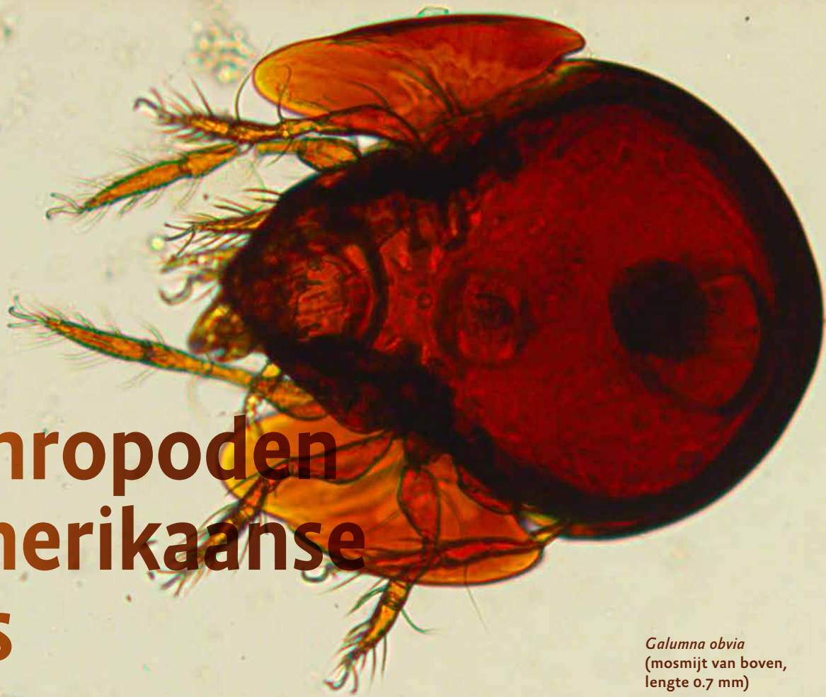
Galumna obvia (mosmijt van boven, lengte 0.7 mm)