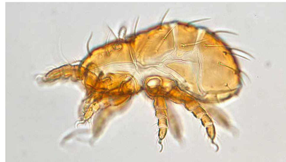
Liochthonius neglectus (mosmijt van opzij, lengte ca. 0.180 mm)