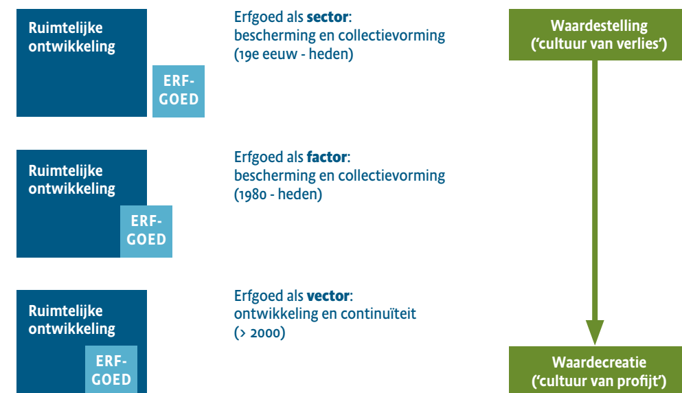
Figuur 1 Verschuiving van de louter sectorale benadering van erfgoed naar een benadering waarbij erfgoed richtinggevend is voor de gekozen oplossing.

er doorheen stroomt, heeft nu de capaciteit om in geval van piekafvoeren na hevige regenval, het water zonder problemen af te voeren en kan buiten de oever treden zonder dat dit schade aan het park of de omgeving oplevert. “Fun fact”: deze ingreep was kort voor het hoogwater in Zuid-Limburg in juli 2021 gereed gekomen, en de werken langs beek en het park hielden stand! In het verlengde van het park zal de Keutelbeek, een aftakking van de Geleenbeek, in het centrum gedeeltelijk worden ontkluïsd en daarmee weer zichtbaar worden. Dit zorgt voor betere afvoer van regenwater op piekmomenten, terwijl het ook de historische relatie tussen de stad en de beken markeert en bijdraagt aan het tegengaan van hittestress in het centrum. De Grebbedijk tussen Wageningen en de Grebbeberg moet in het kader van het Hoogwater Beschermingsprogramma (HWBP) worden verhoogd. Aan de voet van de Grebbeberg ligt ook het achttiende-eeuwse Hoornwerk. Een verhoog-