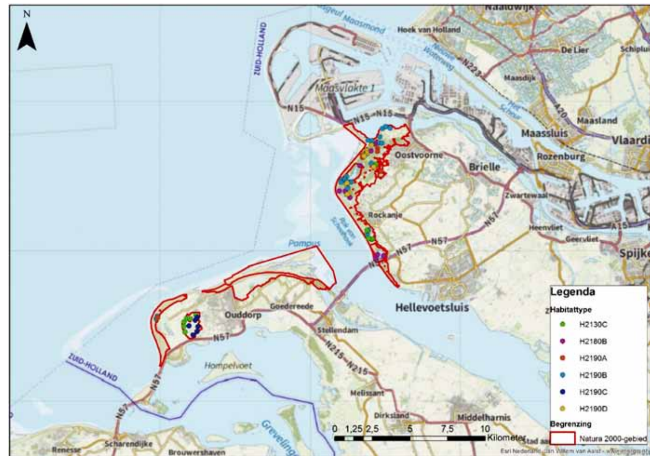
Figuur 1. Ligging Natura 2000-gebieden “Voornes Duin” en “Duinen Goeree & Kwade Hoek” en de daarbinnen gebruikte monsterlocaties.

Het aantal in potentie relevante parameters is schier eindeloos (KWR, 2014). In de pilot is er voor gekozen om zo mogelijk potentieel relevante parameters op te nemen in het meetprogramma. Vandaar dat voor elk van de 82 monsterlocaties 24 parameters zijn gemeten die verband houden met