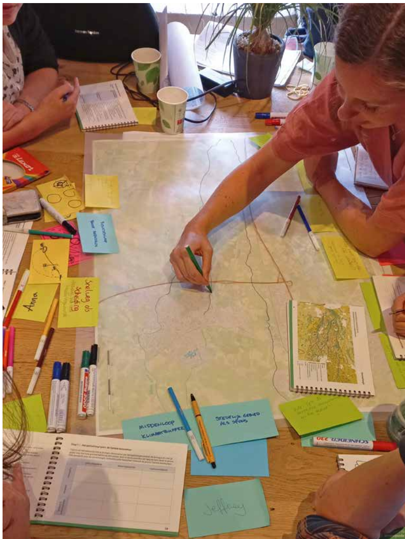
Rechts: ontwerpen aan het Barneveldse Beekgebied.