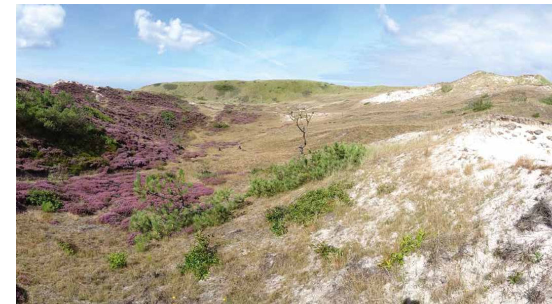
Foto 3. Het habitattype duinheiden met struikheide (EUNIS N19, habitattype 2150) in het Camperduin, onderdeel van het Natura 2000-gebied Schoorlse duinen.

In Zwitserland zijn in een stikstofgradiënt (5-37 kg N/ha/jaar) de effecten van stikstof op montane graslanden (EUNIS R23; habitattype H6520) onderzocht. De critical load werd in 2011 op basis van een deskundigenbeoordeling vastgesteld op 10 à 20 kg N/ha/jaar. Uit de gradiëntstudie blijkt dat er rond een depositie van 15 kg N/ha/jaar een omslag plaatsvindt, waarbij karakteristieke voedselarme soorten worden vervangen door minder tot niet kenmerkende voedselrijke soorten (figuur 1). Mede op basis van deze gradiëntstudie is de bandbreedte van de critical load voor montane graslanden bijgesteld naar 10-15 kg/ha/jaar, waarbij de betrouwbaarheid is aangepast naar vrij betrouwbaar.