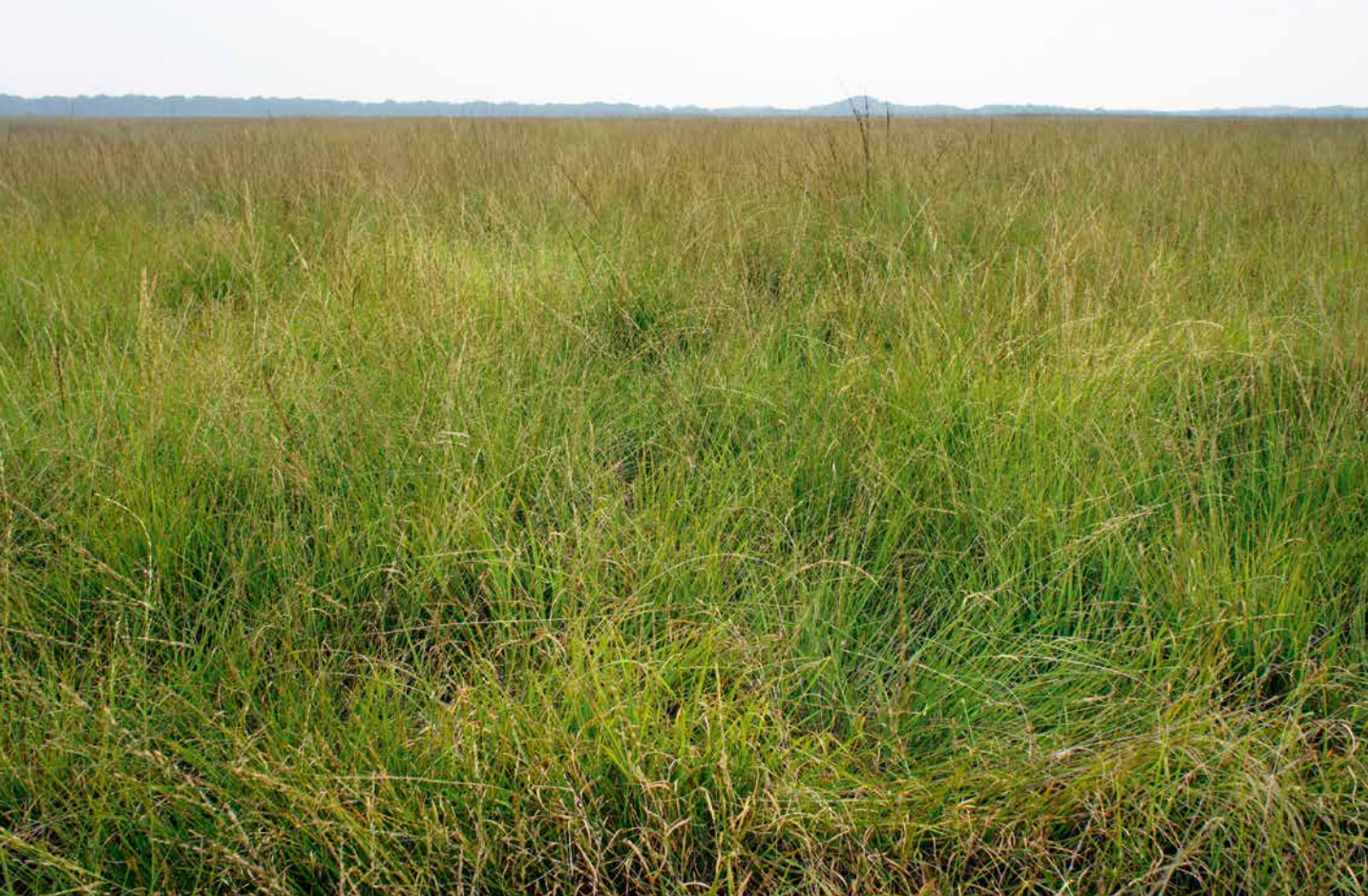
Foto 1. In Nederland heeft de langdurige overschrijding van de critical load voor stikstof in heidesystemen geleid tot een dominantie van grassen ten koste van karakteristieke heidesoorten.