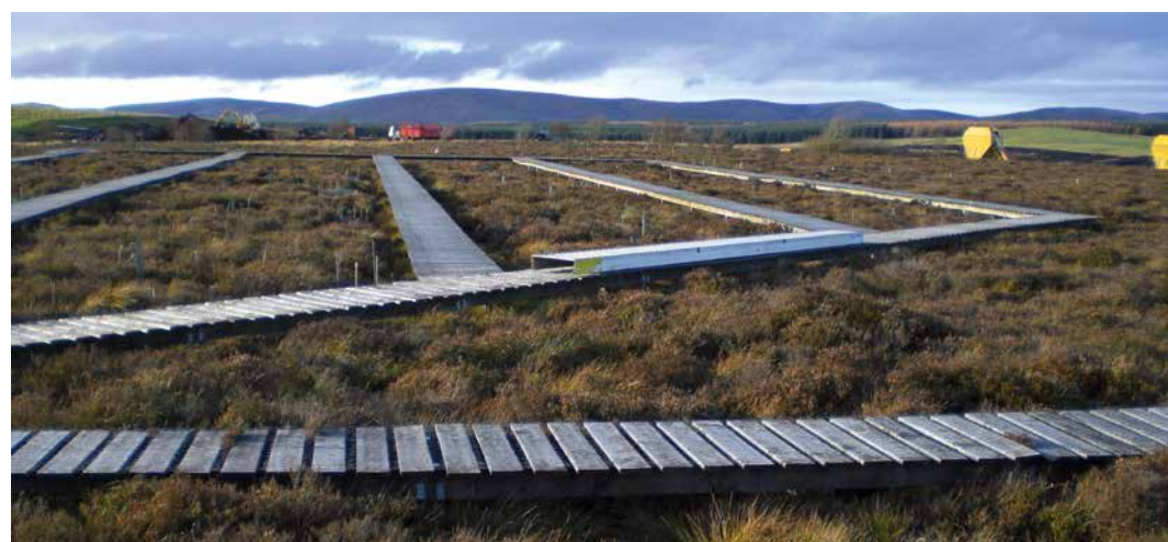
Foto 2. Het langlopende stikstofadditie-experiment van het UK Centre for Ecology and Hydrology in Whim Bog (Schotland). Sinds 2002 worden verschillende vormen van stikstof (ammoniak, ammonium en nitraat) in verschillende doseringen toegevoegd in proefvlakken in vochtige heide op veen bij een achtergronddepositie van 8 kg N/ha/jaar.