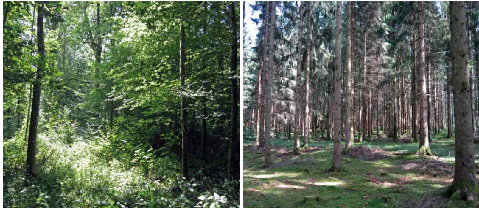
Figuur 1. Een twin-plot bestaande uit een plot met gemengd loofhout (links) en een plot met monocultuur van fijnspar (rechts)

er bij verschillende boomsoorten aluminium-toxiciteit op. Omdat regenwormen niet langer kunnen aarden in zulke zure systemen stopt de door hen uitgevoerde vermenging van organisch materiaal met de minerale bodem. Dit veroorzaakt een loskoppeling van de top- en onderlagen in de bodem en het nutriëntentransport ertussen. De terugval in variabiliteit van zowel biotische als abiotische bodemeigenschappen (zoals gemeten in het lab), werd veroorzaakt door de omvorming naar fijnspar. Deze afname in variabiliteit komt overeen met de afname in biodiversiteit, vroeger al gerapporteerd bij monoculturen van fijnspar.